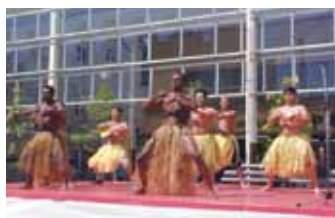
※2015さが国際フェスタ月間のようす