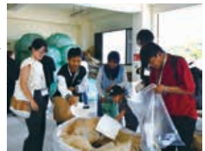
(吉野ヶ里町 meet up よしのが里)

正しい分別の仕方を知ることは、誰もが暮らしやすい環境づくりの第一歩。参加者全員でリサイクルセンターを訪れ、教室で学んだとおり実際に分別をしてみました。