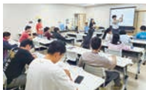
(嬉野市 カフェこくさいじん)

難しい用語も多いため、ピンゴ形式で楽しく学習。警察職員からも詳しい説明を受け、理解を深めました。