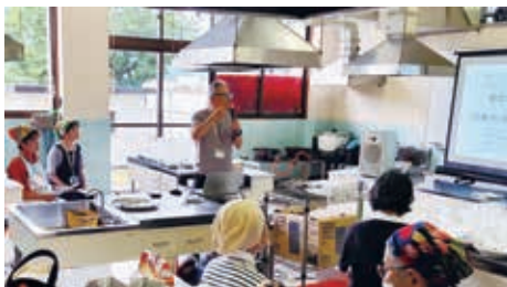
(大町町 にほんご こりすくらぶ)