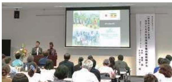
「【紛争地の真実と希望】元子ども兵社会復帰支援の最前線から」