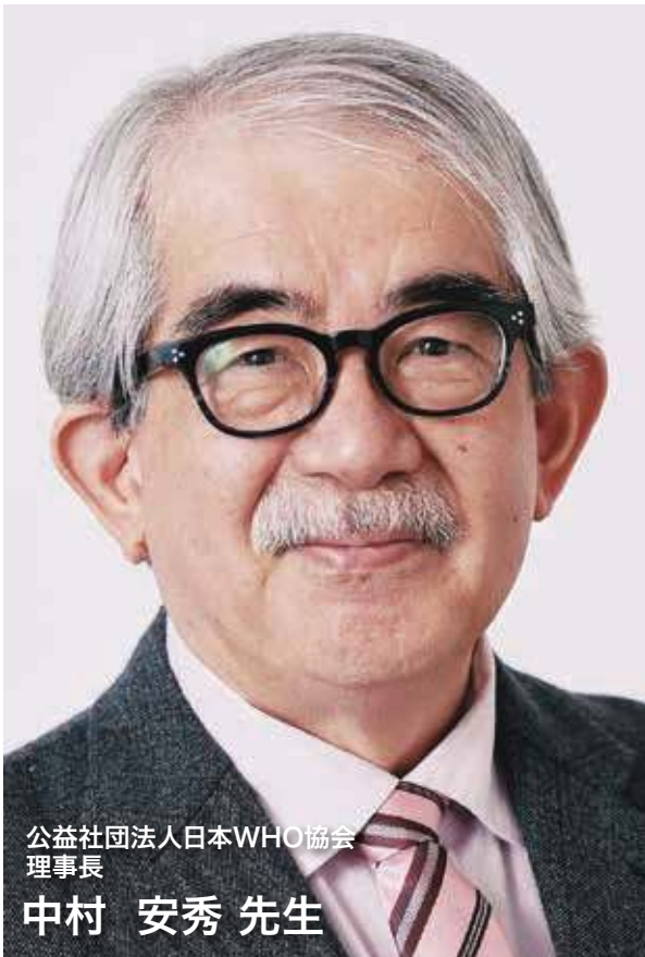
公益社団法人日本WHO協会 理事長