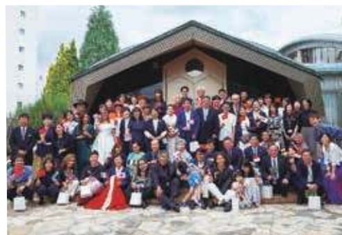
地球市民賞受賞記念SPIRA交流会

どちらのイベントにもたくさんの方にお越しいただき、盛会のうちに終了することができました。皆様の熱心なご参加により、大変充実したセミナーとなりましたことを心より感謝申し上げます。