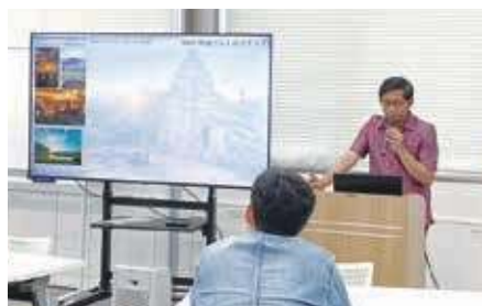
「ស្ត្រី កម្ពុជា! ស្តេស្តា! កម្ពុជា!»