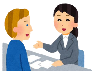
来訪者 行政窓口 医療機関