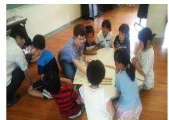
ユンノリ遊び(すごろく)