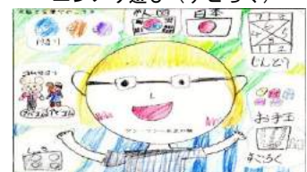
受講者の児童がかいてくれた作品