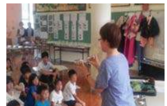
食器等で食べ方の実演