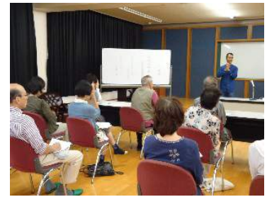
カンボジアの紹介