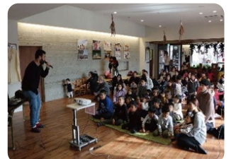
チュニジアの話に興味津々!

・なかなか馴染みのない北アフリカの国について、実際にその国の方からお話を聞くことができ、大変良い学びの機会になった。 ・パワーポイントでのお話も、こども園、保育園の子どもたちでも分かりやすいように工夫をいただいていたので、とても良かった。 ・歌やゲームは、日本でも似たようなものがあるものだったため、理解しやすく、2人組で行うことで参加者の雰囲気も良かった。また、簡単な単語や数の数え方も含まれていて、子どもたちも興味を持って取り組んでいた。 ・継続した取り組みとして今後も続けていきたい。