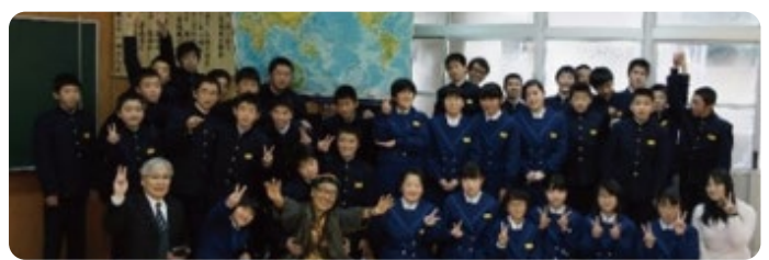
先生/生徒と記念写真