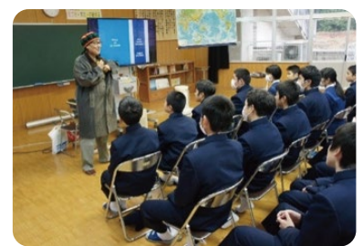
生徒の前で挨拶をする講師

・セントルシアという国を初めて知った。行ってみたいと思った。 ・私も障害者の方を助けられるボランティア活動をしたいと思った。 ・スティールパン(楽器)の音色がきれいだった。