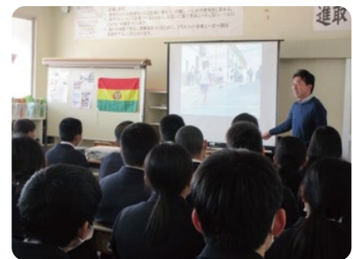
ボリビアの話をする講師