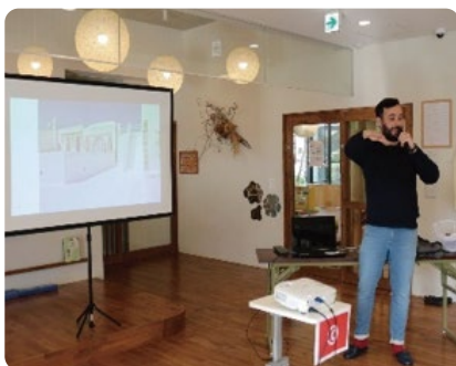
チュニジアの紹介